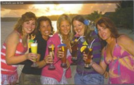
De verhalen van het CMIO 2009