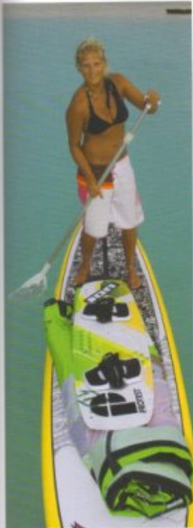
Contraits van de boot