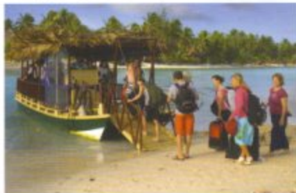
Arnell Laguna Resort & Spa