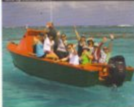
Stijf op Paradijs best